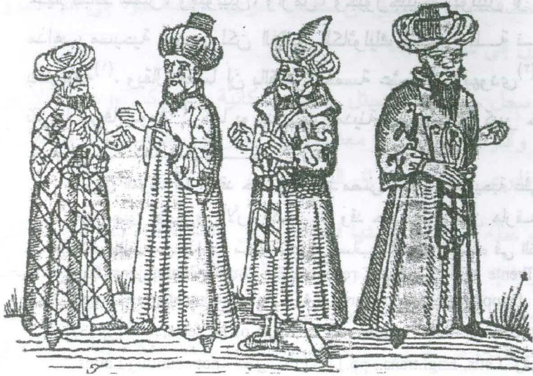
رسم رقم (١٠) عناصر السكان الأربعة